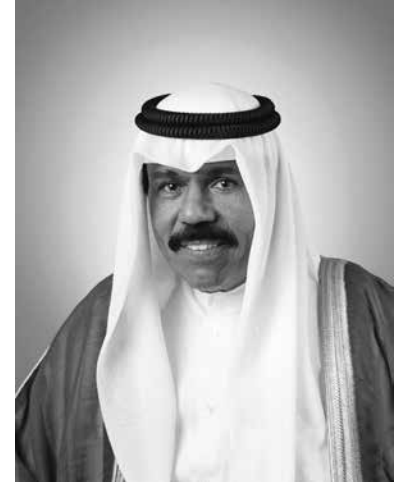
سمو الشيخ نواف الأحمد الجابر الصباح ولي عهد دولة الكويت