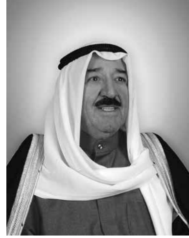
صاحب السمو الشيخ صباح الأحمد الجابر الصباح أمير دولة الكويت