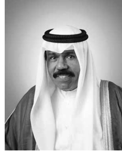
سمو الشيخ نواف الأحمد الجابر الصباح ولي عهد دولة الكويت