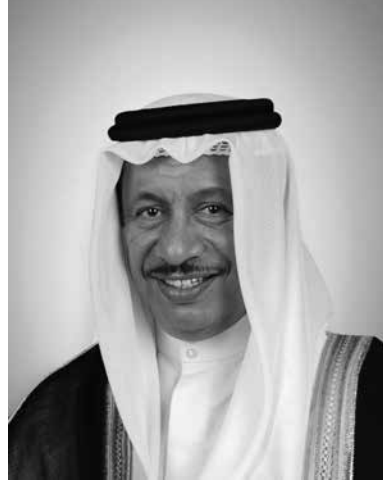
سمو الشيخ جابر المبارك الحمد الصباح رئيس مجلس الوزراء - دولة الكويت